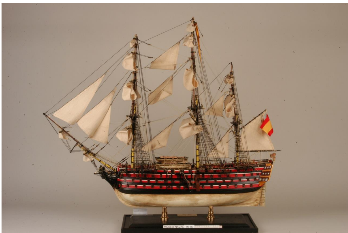
El “Santísima Trinidad, el mayor navío de su época, era la excepción y no la regla. Los británicos contaron siempre con una mayor proporción de buques de tres puentes que los españoles. Museo Naval (Madrid)

razonable superioridad numérica. 49 Pero en la guerra en la mar –guerra, insisto, de movimientos, donde no cuenta la posesión del terreno, siempre momentánea– la velocidad no solo es un elemento imprescindible de la maniobra táctica, útil para buscar posiciones ventajosas frente al enemigo, como lo sería en el combate en tierra. 50 Es, además, el elemento crítico que da la iniciativa táctica a uno u otro bando, porque permite a los comandantes de las escuadras más veloces decidir cuándo y en qué condiciones entrar en combate. De ahí la desesperanzadora afirmación de Mazarredo en 1782: “Hoy se puede sentar como axioma que navío no forrado en cobre no vale nada sino para ir de un puerto a otro cuando sea más fuerte que su enemigo.” 51